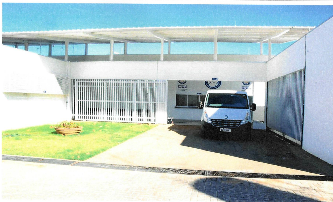
Dispõe de veículo tipo furgão refrigerado para uso exclusivo da CEMURF