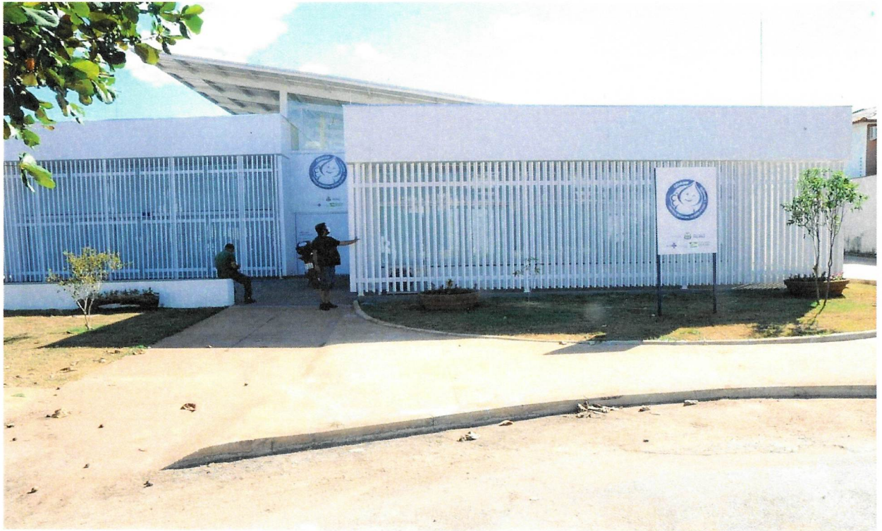
Sede da Central Municipal de Frios de Palmas (CEMURF)