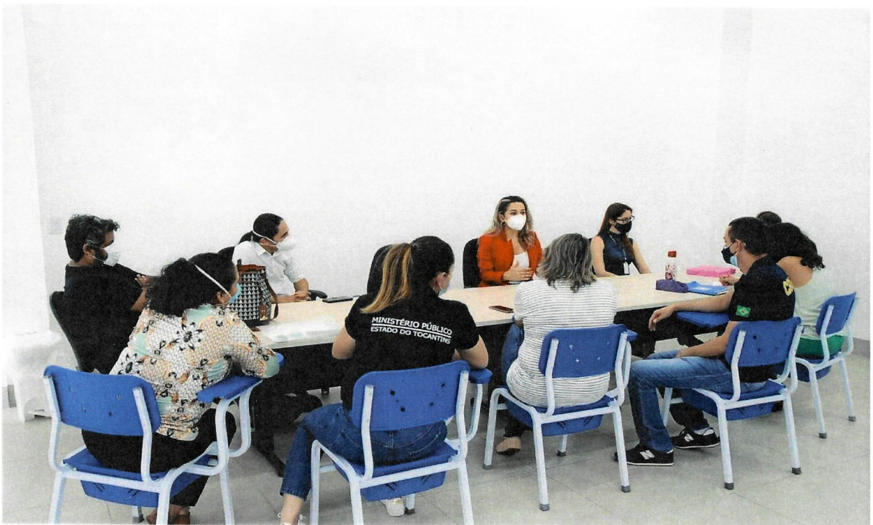
Reunião onde foram repassadas as informações de acondicionamento e logísticas das vacinas.