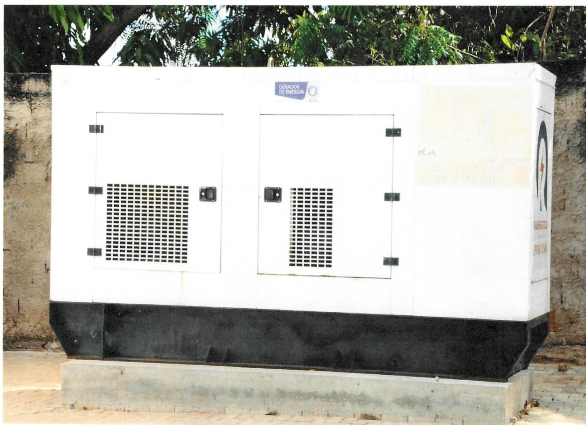
CEMURF é equipada com gerador de energia