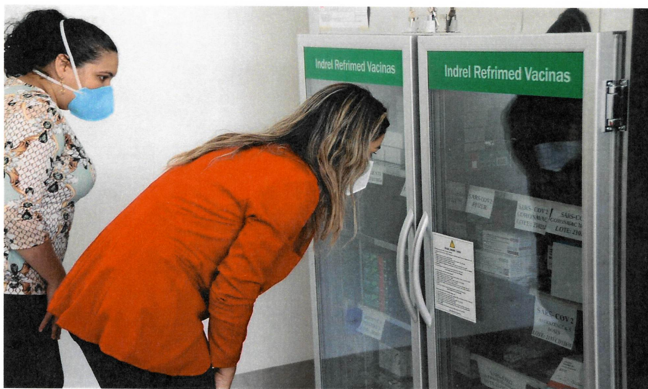
Conferência das vacinas no refrigerador da CEMURF