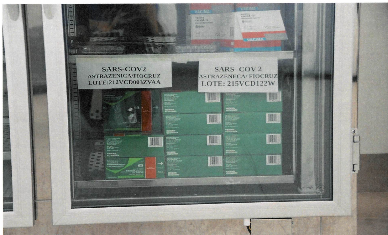
Imunizantes separados e identificados para a D2