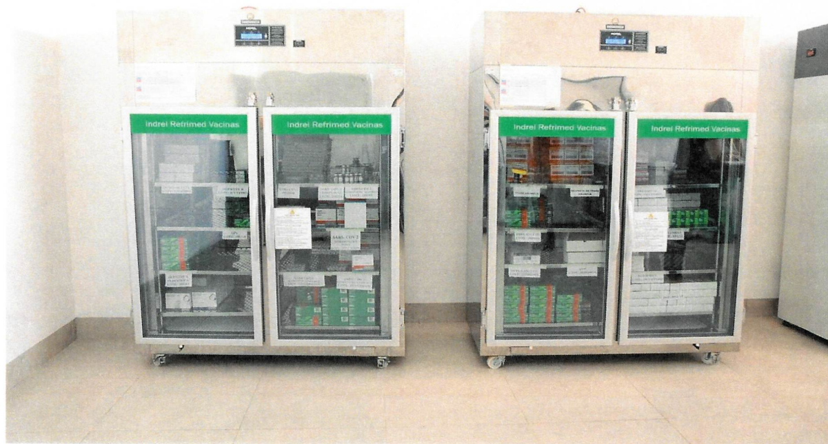
Refrigeradores onde são armazenadas as vacinas contra a Covid-19