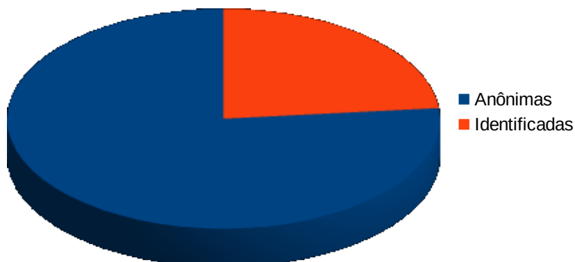
Tipos de Manifestações Quanto à Identificação

Quantidade de Manifestações anônimas: 6.314 Quantidade de Manifestações Identificadas: 1.938