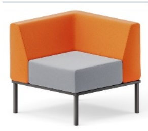
*imagem de referência

Especificação: Garantia: mínima de 5 anos