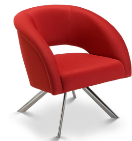
*imagem de referência

Especificação: Garantia: mínima de 5 anos