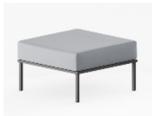
*imagem de referência

Especificação: Garantia: mínima de 5 anos