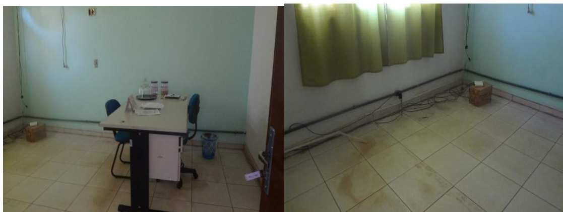
Sujeira nas instalações da DEIC de Araguaína