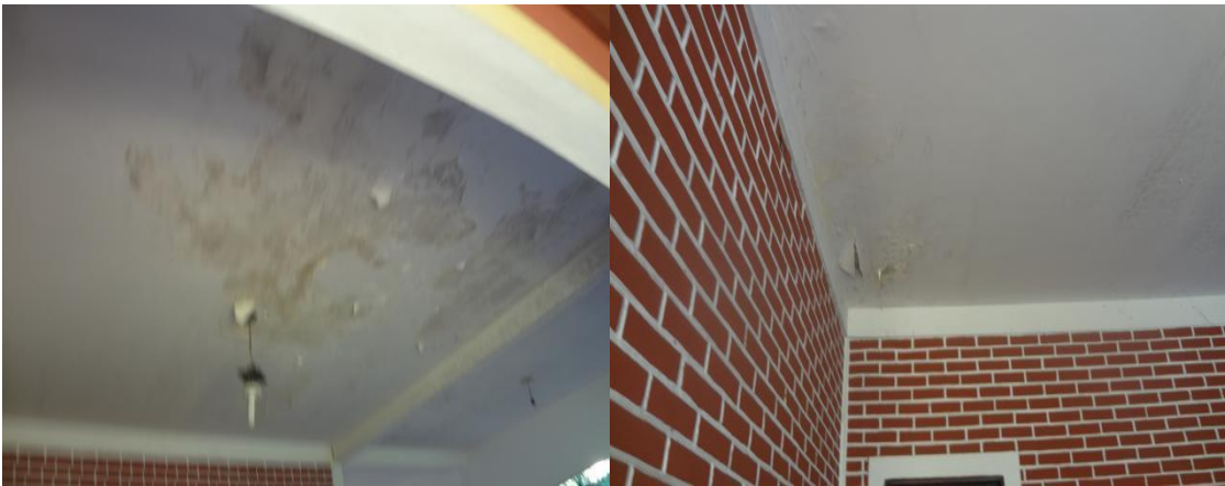
Infiltração no prédio da DEIC de Araguaína, inclusive no teto