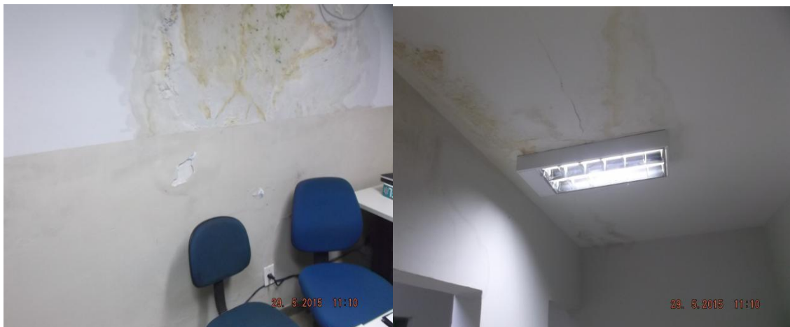
Infiltração nas paredes da Central de Flagrantes

Defeito ou falta de equipamento de ar-condicionado, salas inadequadas, divididas por gesso, sem isolamento acústico (prejudicando o sigilo das investigações ou respeito à intimidade dos jurisdicionados), salas com mofo, problemas com infiltração, muita sujeira, ausência de iluminação adequada, ausência de depósito para acomodar produtos objeto de crime, pátio repleto de vegetação (mato), vazamentos em instalações hidráulicas, foram uns dos vários problemas encontrados nas estruturas das delegacias, tudo conforme relatórios elaborados pelos Oficiais de Diligência do Ministério Público, devidamente acompanhados por fotografias (relatórios inclusos no Inquérito Civil nº 001/2015) 3 .