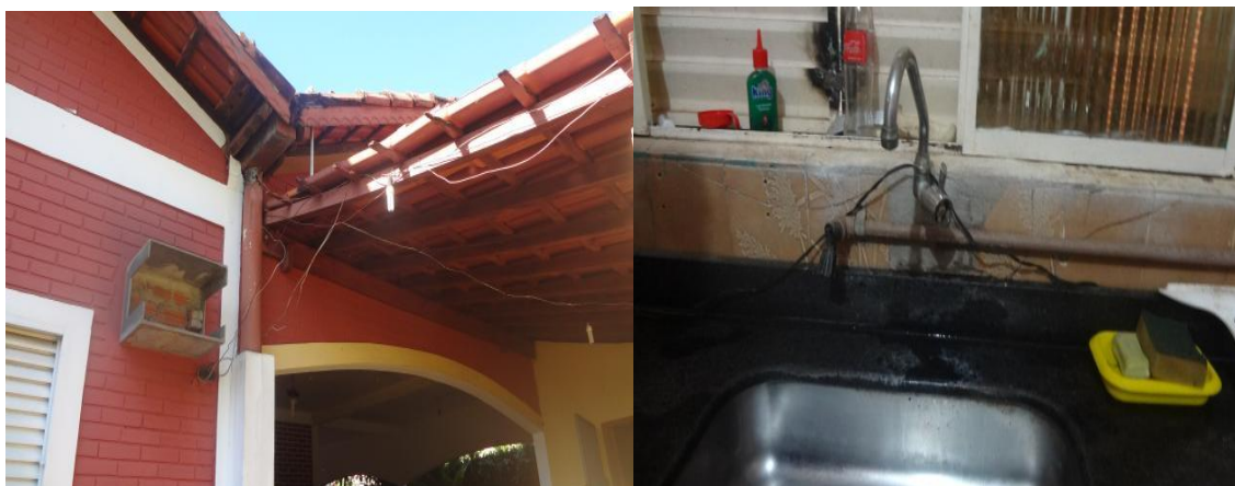
Precariedade das instalações da DEIC de Araguaína

3ª PROMOTORIA DE JUSTIÇA DE ARAGUAÍNA CRIMES DOLOSOS CONTRA A VIDA, CRIMES CONTRA AS RELAÇÕES DE CONSUMO E CONTROLE EXTERNO DA ATIVIDADE POLICIAL AV. NEIEF MURAD, NO 47-A – SETOR NOROESTE – CEP 77.800-000 – FONE/FAX (63) 3414-4641 E 3414-8509