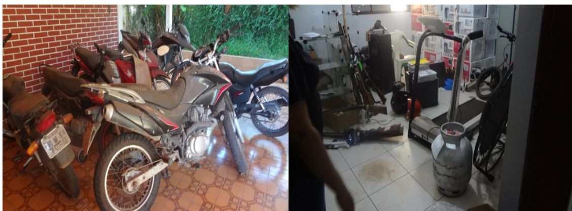
Depósito de bens apreendidos sem instalações adequadas na DEIC de Araguaína