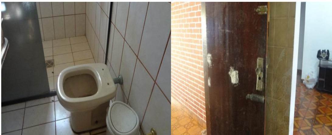
Precariedade das instalações da DEIC de Araguaína