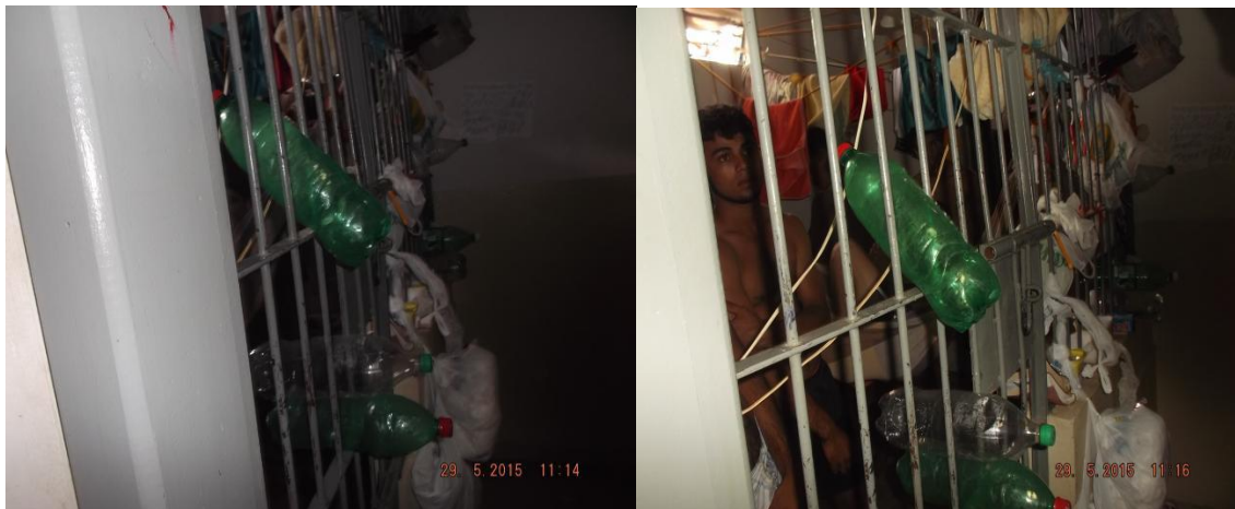
Cela da Central de Flagrantes superlotada e em péssimas situações

3ª PROMOTORIA DE JUSTIÇA DE ARAGUAÍNA CRIMES DOLOSOS CONTRA A VIDA, CRIMES CONTRA AS RELAÇÕES DE CONSUMO E CONTROLE EXTERNO DA ATIVIDADE POLICIAL AV. NEIEF MURAD, NO 47-A – SETOR NOROESTE – CEP 77.800-000 – FONE/FAX (63) 3414-4641 E 3414-8509