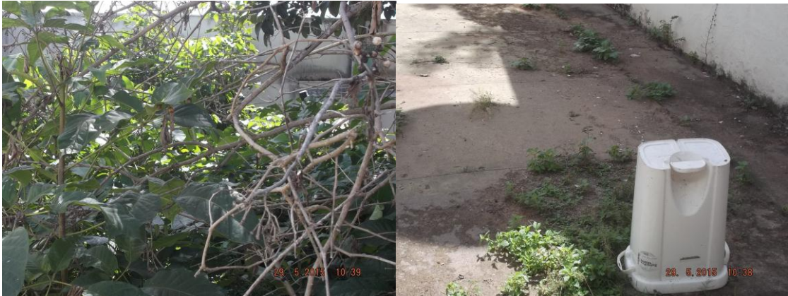
Mato no pátio do Complexo das Delegacias de Polícia de Araguaína

3ª PROMOTORIA DE JUSTIÇA DE ARAGUAÍNA CRIMES DOLOSOS CONTRA A VIDA, CRIMES CONTRA AS RELAÇÕES DE CONSUMO E CONTROLE EXTERNO DA ATIVIDADE POLICIAL AV. NEIEF MURAD, NO 47-A – SETOR NOROESTE – CEP 77.800-000 – FONE/FAX (63) 3414-4641 E 3414-8509