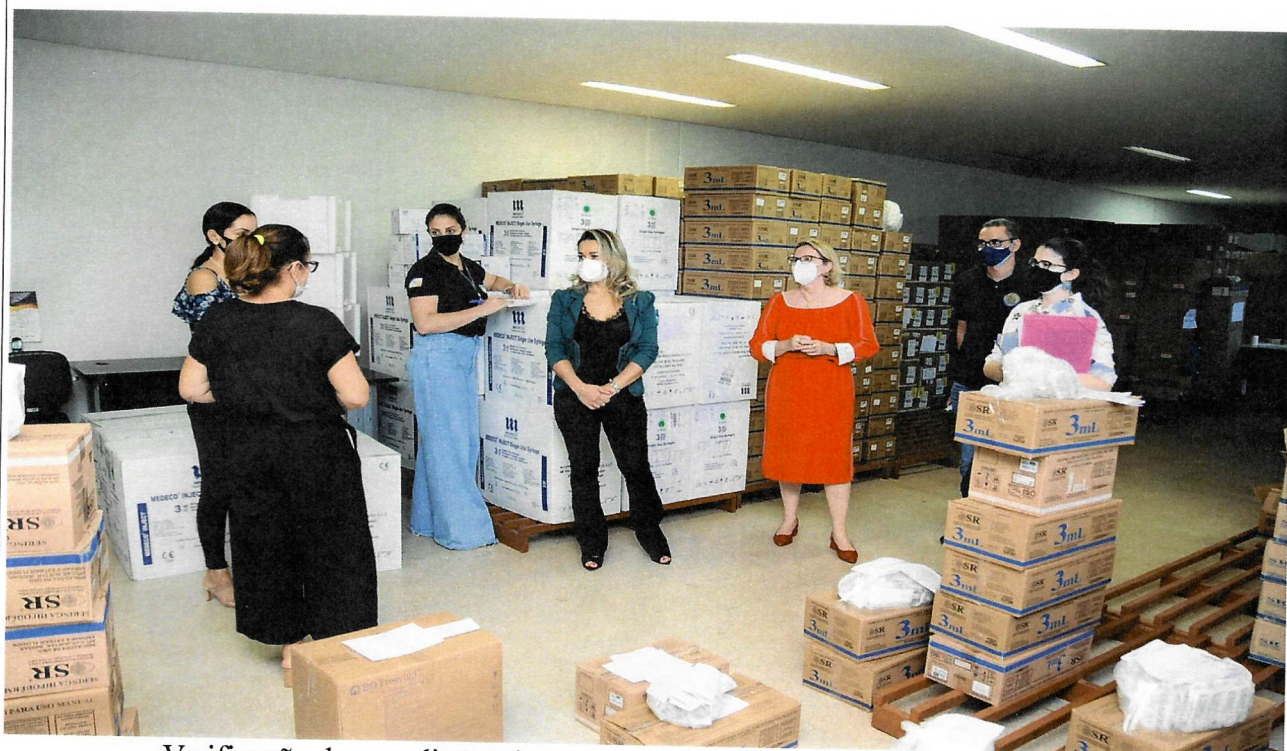
Verificação das condições de armazenamento das vacinas no almoxarifado