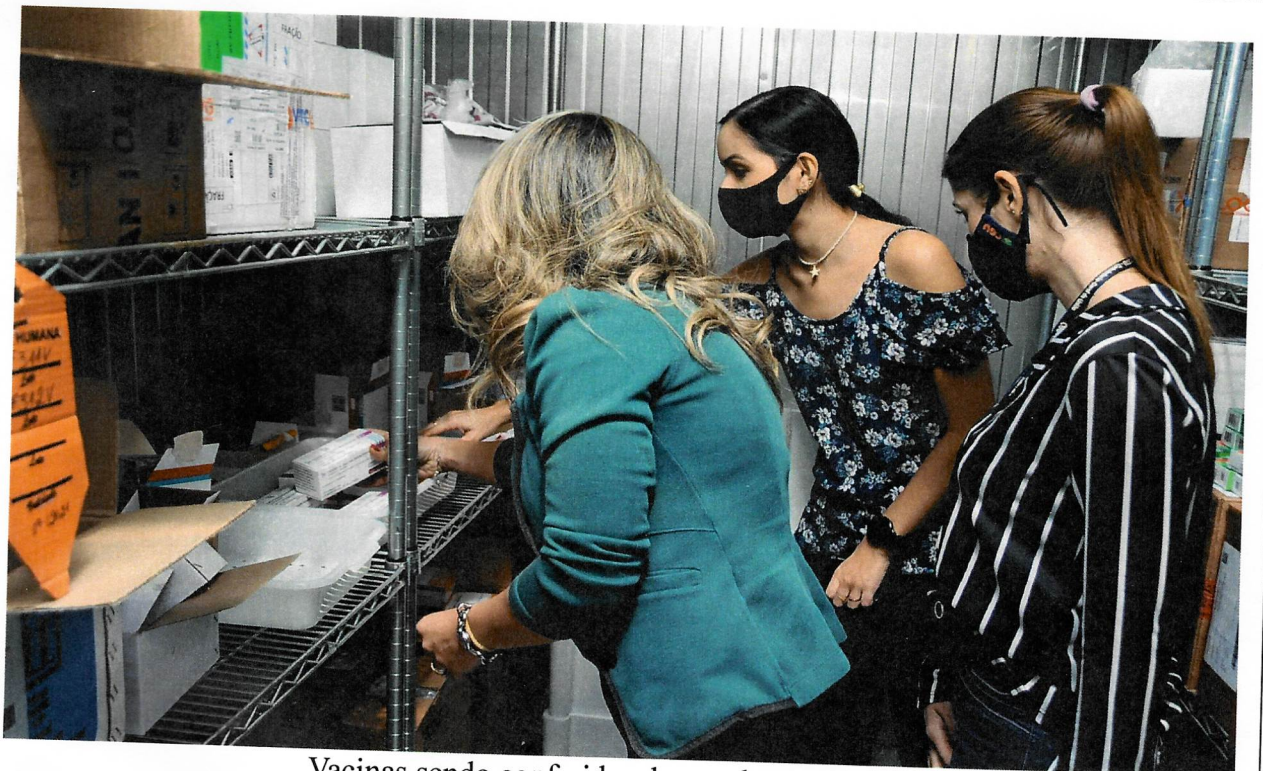
Vacinas sendo conferidas dentro da câmara fria

[Handwritten signatures and initials in blue ink]