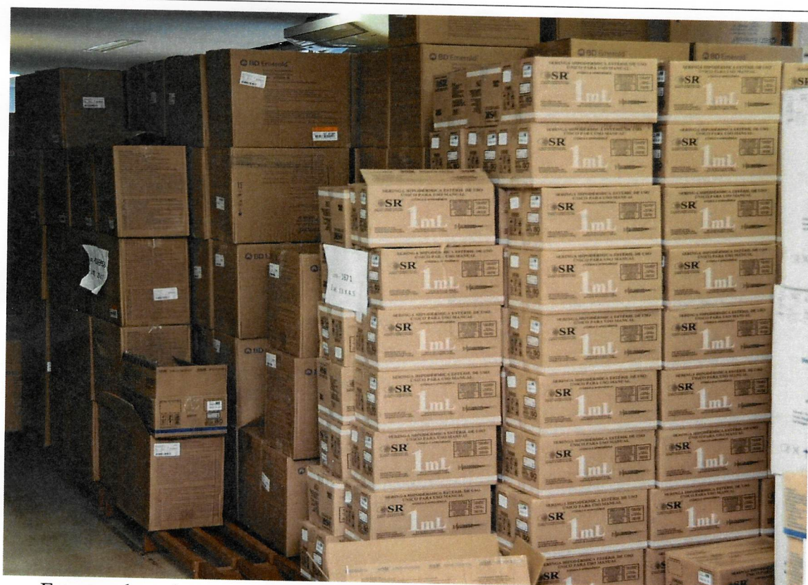
Estoque de seringas, que são enviadas aos municípios junto com as vacinas.