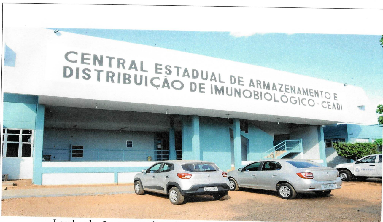
Local onde são armazenadas e distribuídas as vacinas contra a Covid-19