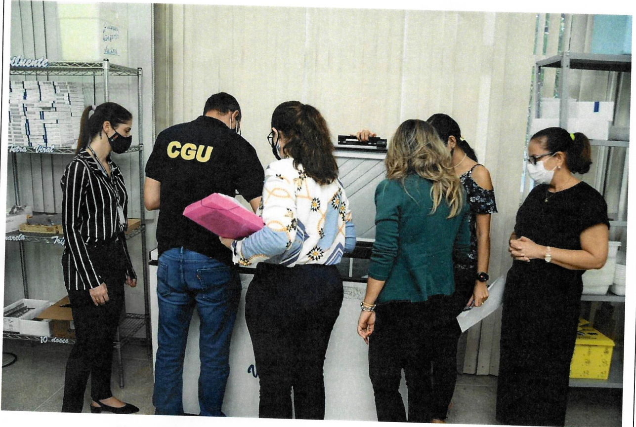
Verificação de armazenamento do imunizante da Pfizer a -20°