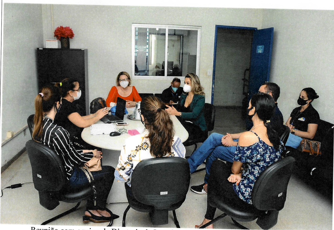
Reunião com equipe da Diretoria de Imunização da Secretaria Estadual da Saúde