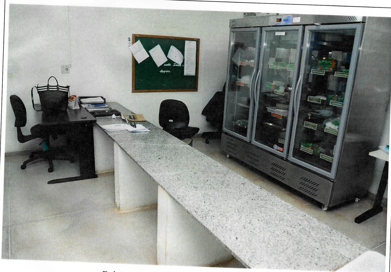
Balcão para manuseio e contagem das vacinas