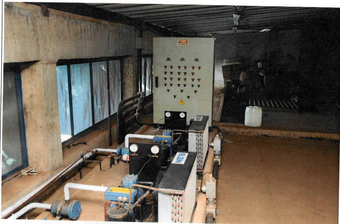
Gerador de energia usando quando há queda da energia elétrica.