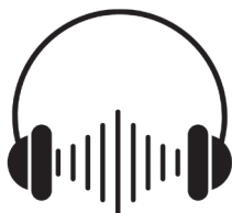
#ParaCegoVer Desenho de um fone de ouvido