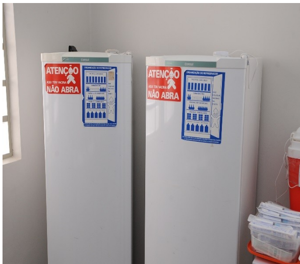
A UBS possui dois refrigeradores

A sala de vacina da UBS Vila São José tem condicionado de ar e possui dois refrigeradores verticais com controle de temperatura por termômetro e um freezer horizontal, no qual ficam guardadas as placas de gelo que são utilizadas para o acondicionamento e transporte das vacinas.