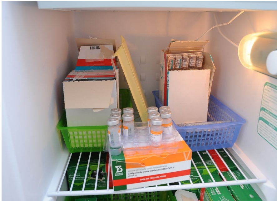
Vacinas armazenadas dentro dos refrigeradores