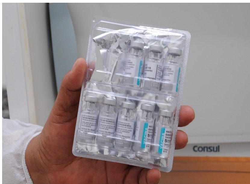
Doses de vacinas na UBS do Setor Aeroporto

Assim, parte de equipe deslocou-se até o Posto de Saúde do Setor Aeroporto, que fez a conferência das doses e confirmou a quantidade informada.