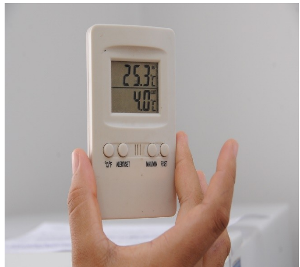
Termômetro para controle de temperatura