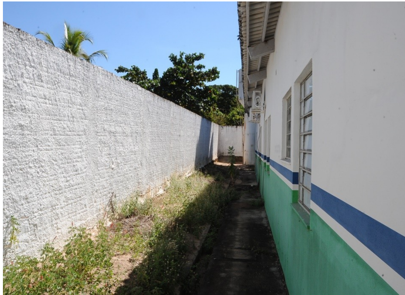
Vista lateral da UBS rodeada por muros

Quanto a segurança do local apurou-se o seguinte: