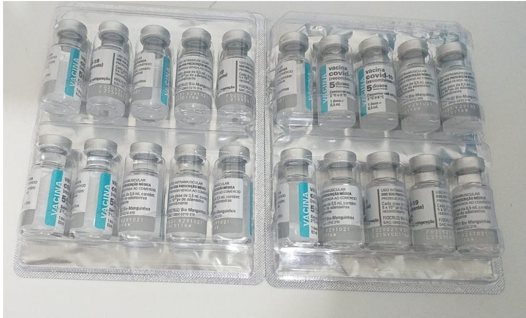
100 doses de vacinas na UBS da Vila Quixaba

Sintetiza-se, na tabela a seguir, as doses de vacinas contabilizadas em Peixe: