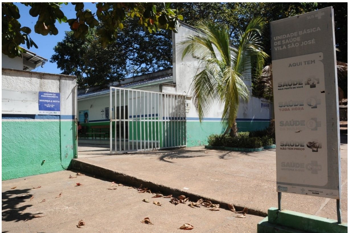
Foto da vista frontal da UBS Vila São José