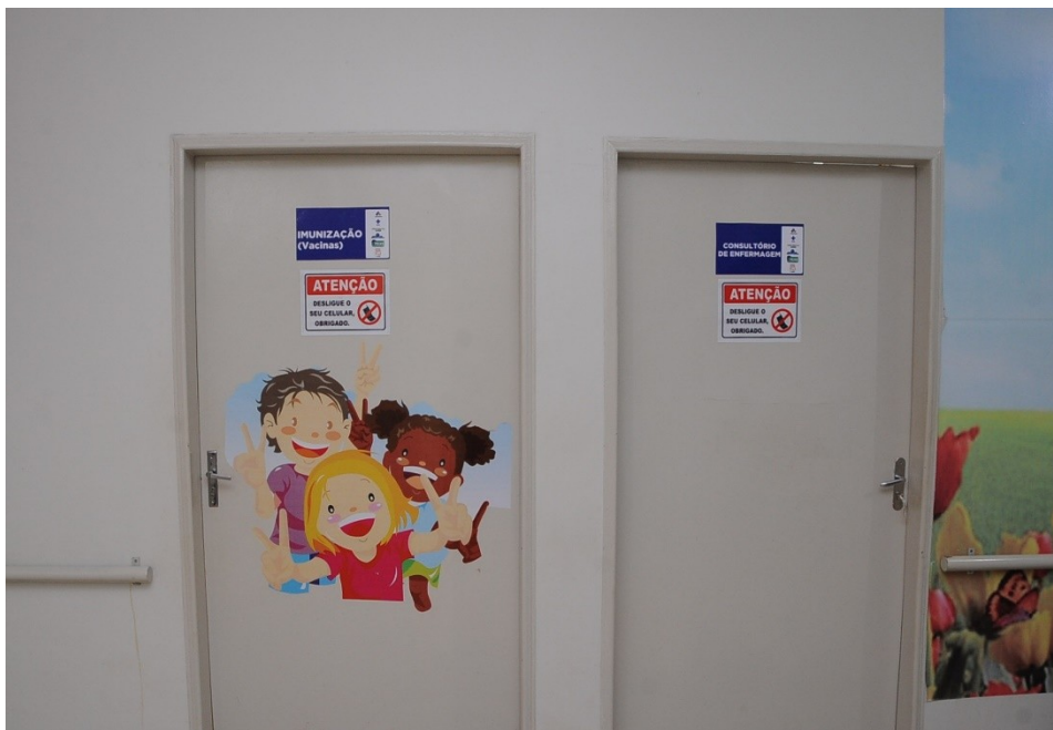
Sala de Imunização da UBS Vila São José 1