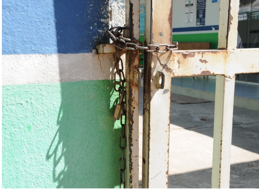
Trancamento do portão da UBS feito por corrente e cadeado