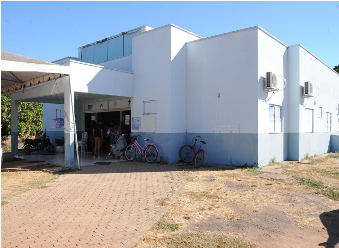
UBS Setor Aeroporto 1